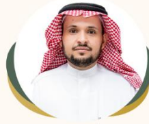
الدكتور / مبخوت بن عبدالله بن محمد الصيغري نائب رئيس المجلس